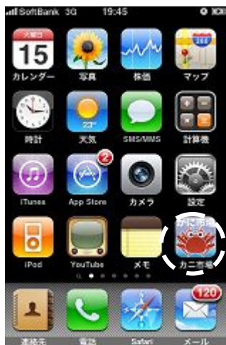
【iPhoneアプリメニュー画面】